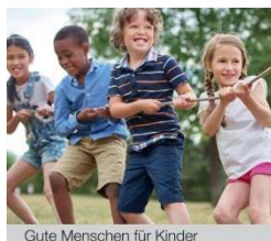
Gute Menschen für Kinder

Caritas-Kollekte des Caritasverbandes der Diözese Speyer am Caritas-Sonntag, den 20. September 2020