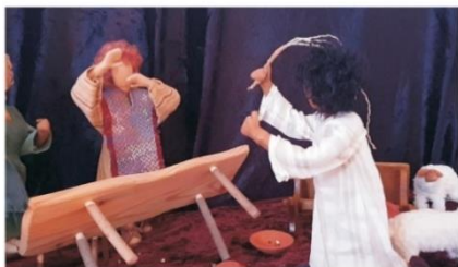
Jesus jagt die Händler aus dem Tempel