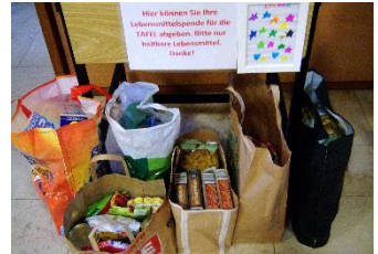
Foto aus St. Pirmin, wo die Lebensmittelspenden gesammelt und

von den Nardinischwestern aufbewahrt werden, bis die Helfer der Tafel sie im Laufe der Woche auf ihrer Tour durch die Stadt abholen. Allen Spendern und Spenderinnen ein herzliches vergeltes Gott, weiter so!